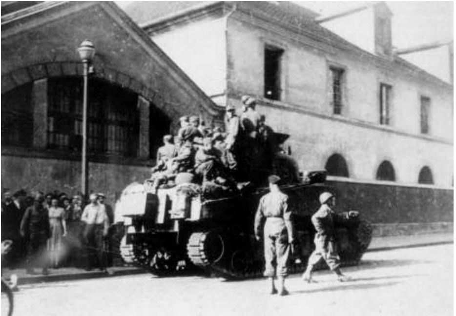
3. Le char Abbeville du 12 e cuirassiers, devant l'Ecole militaire, transportant des prisonniers Allemands, le 25 août.

Prenez l'avenue de la Motte-Piquet puis l'esplanade des Invalides et tournez à droite sur le quai d'Orsay.