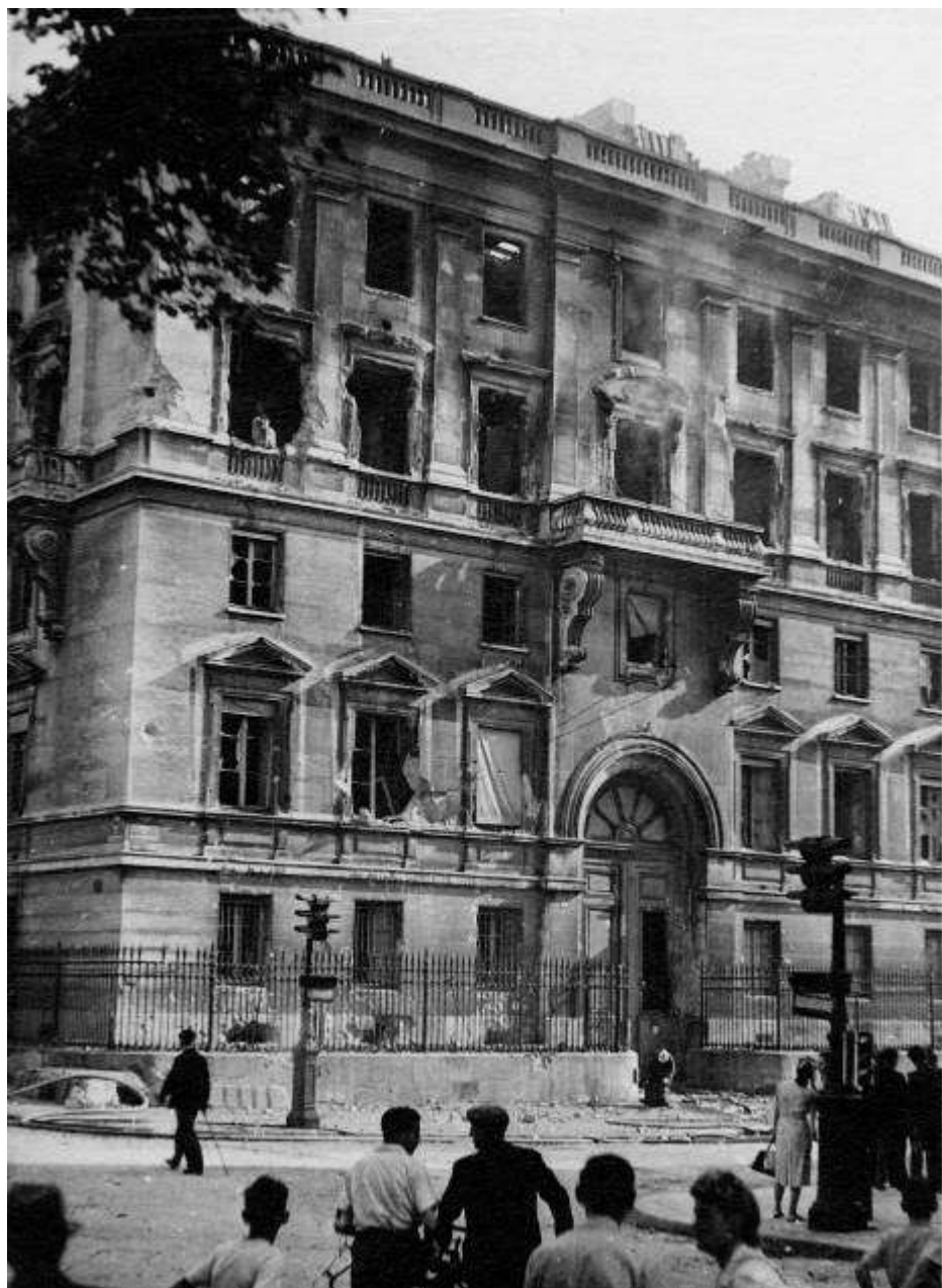
4. Vue latérale du ministère des Affaires Etrangères endommagé par un incendie après les combats, le 25 août 1944.