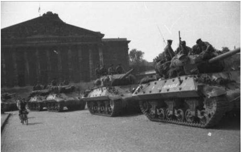
6. Tanks destroyers du Régiment blindé des fusiliers marins sur le pont de la Concorde devant la Chambre des députés.

Sous l'Occupation, le palais Bourbon était occupé par le siège du haut-commandement militaire en France. À partir de 17h, des soldats de la 2 e D.B., accompagnés des F.F.I. et de sapeurs-pompiers progressèrent vers le palais Bourbon pour en obtenir la reddition.