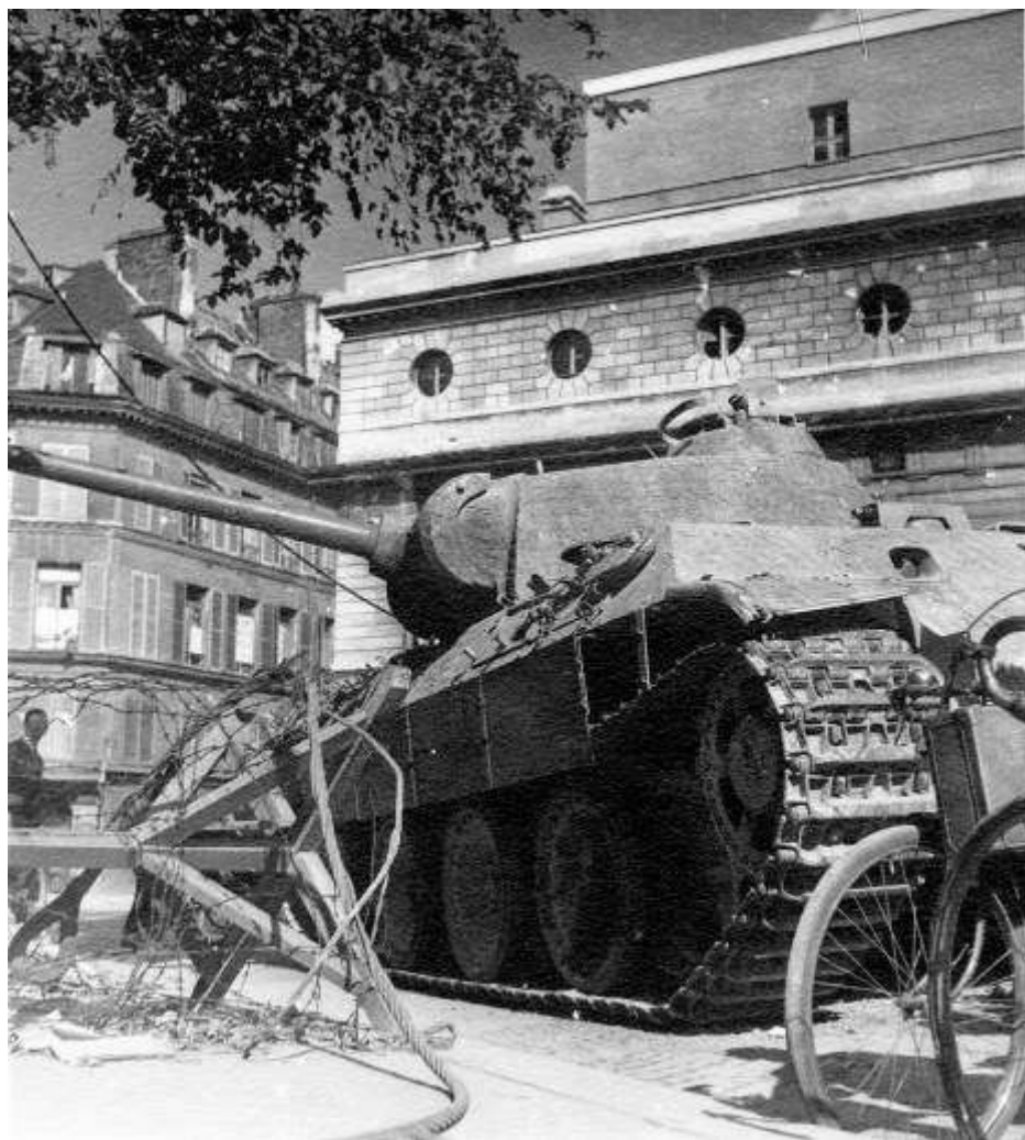
10. Char allemand détruit devant le théâtre de l'Odéon à l'angle de la rue Rotrou et de la rue de Vaugirard.