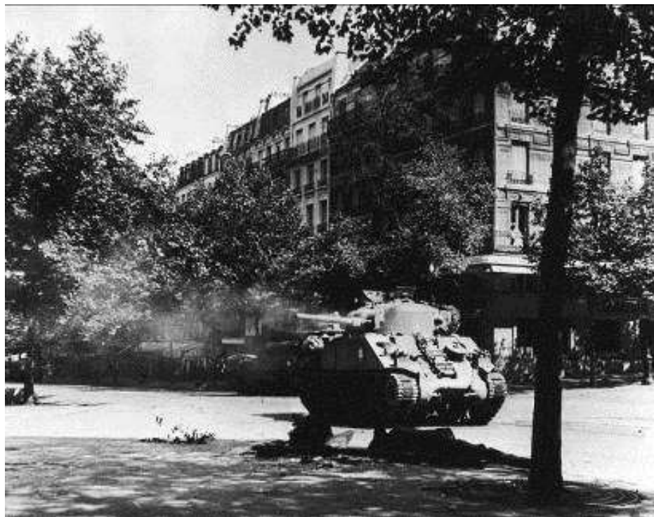
8. Le char Lutzen engagé boulevard Saint-Michel contre un char allemand au Sénat.