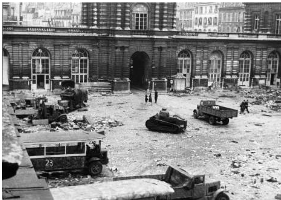
9. Vue de la cour du Sénat après les combats de la Libération.